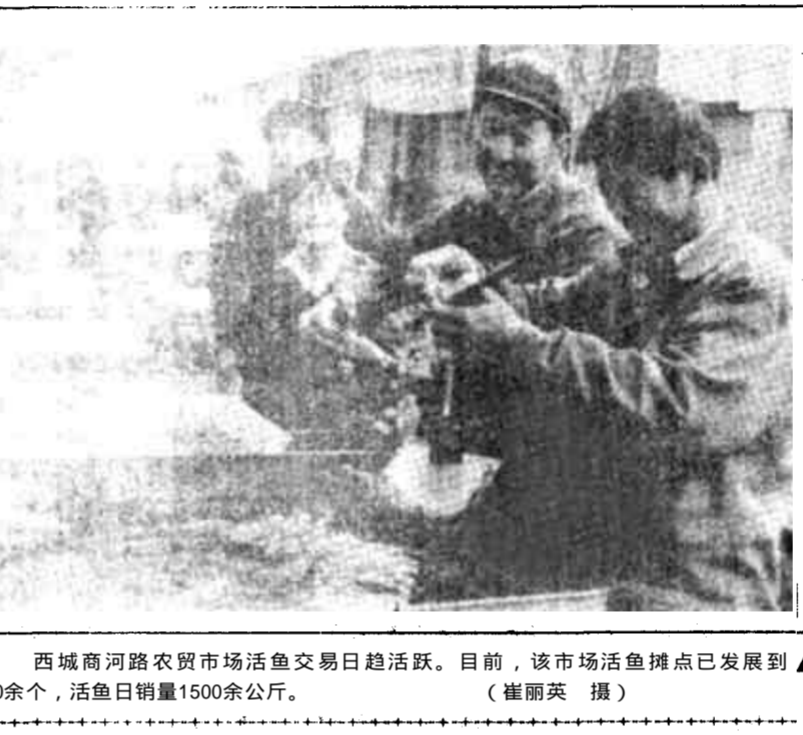
西城河路农贸市场活鱼交易日趋活跃。目前，该市场活鱼摊点已发展到20余个，活鱼日销量1500余公斤。